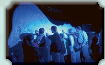
In de Titanic-expo kan de bezoeker de ijsberg zelf aanraken.