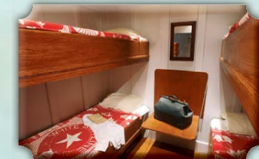
Cabine derde klasse.