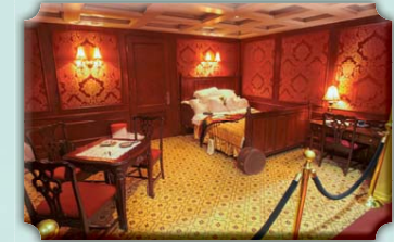
Cabine eerste klasse.