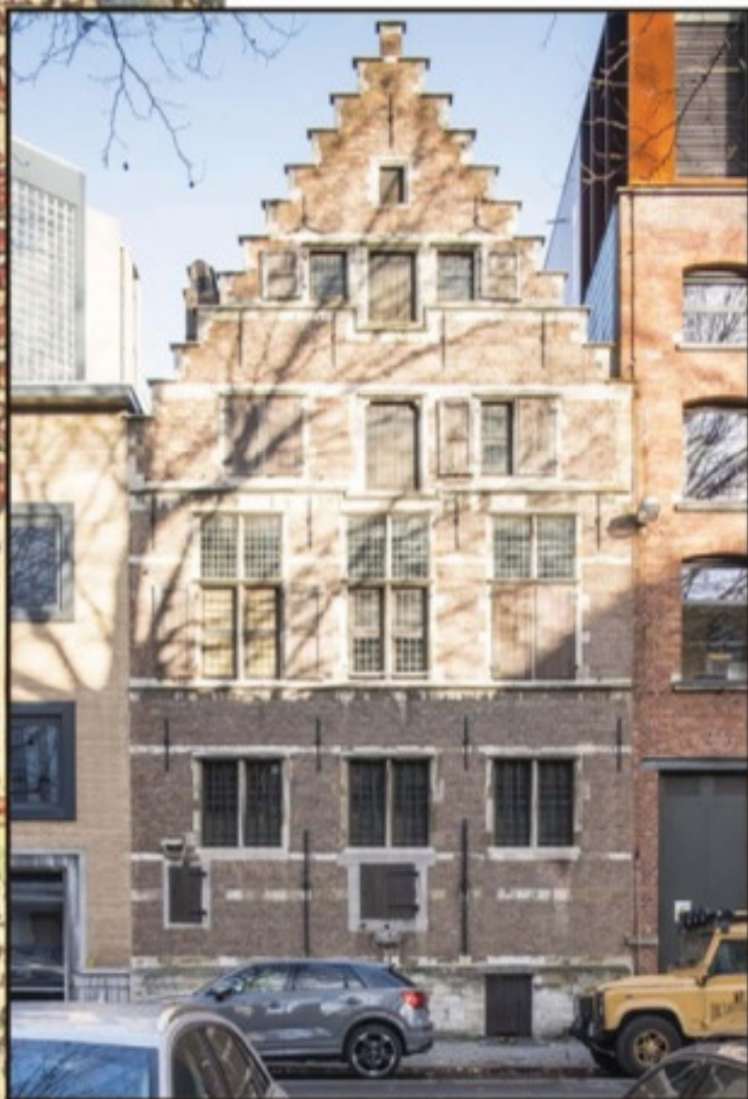
Het Brouwershuis, hier aan de zijde van de Brouwersvliet, wacht nog op restauratie.