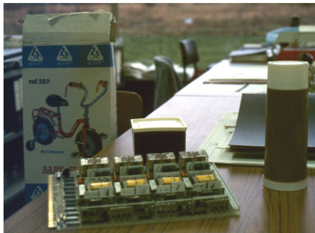
Stilleven in het labo: een trotinette in gezelschap van een GTD-kaart en een koffiethermos.

s Avonds is de dagelijkse tocht naar de bussen wel erg opmerkelijk te noemen. Sommigen betrouwen het Belgische weer niet, en hebben 'smiddags inpakpapier en