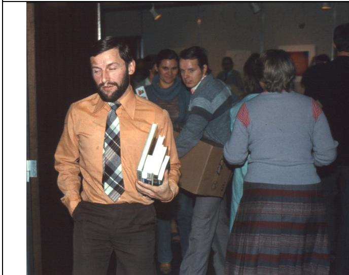
Dit is duidelijk een vader van oudere kinderen: hij heeft boeken gekregen.