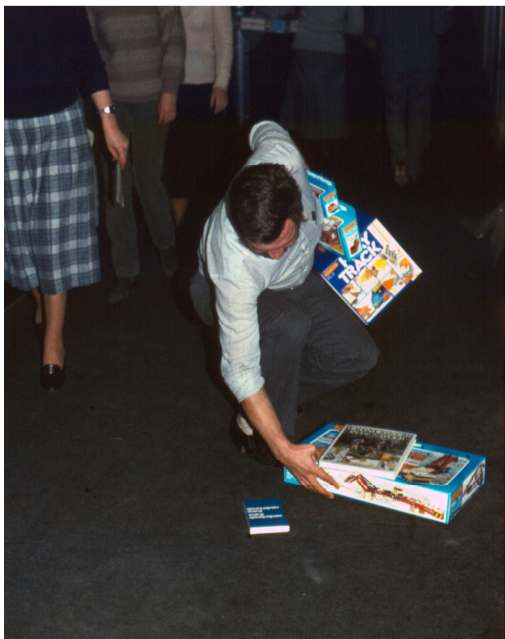
Een vader van een kroostrijk gezin heeft “evenwichtsproblemen”!