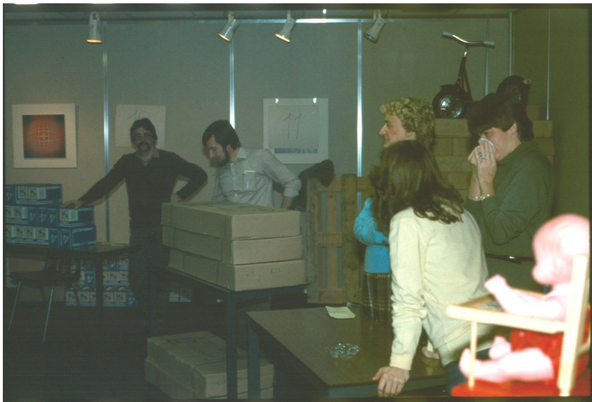
Klazen en klazinessen van de personeelsdienst

En dan de dag zelf. Bij de appel van halftien keken de papa's of de mama's nog eens naar de ponskaarten, of ze wel goed zouden zijn, want hun achterban koesterde hoge verwachtingen. “En wat krijgt uwe kleine nu weer?” vraagt de buurvrouw voor de zoveelste maal.