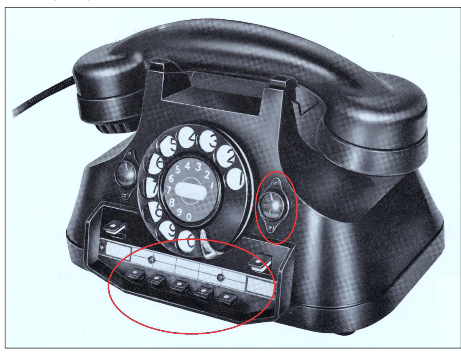
Fig. 5 keys and visual indicator from a 1950 key system

We learned from the (ATEA) archives that this product was launched in 1952. ☎