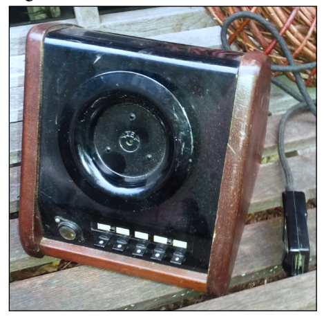
Fig. 1 A "directaphone"

In September 2015 I got a phone call from a 92-year old lady. Her husband, who used to work for a telephone company, passed away and she was cleaning the basement. She did find "some-