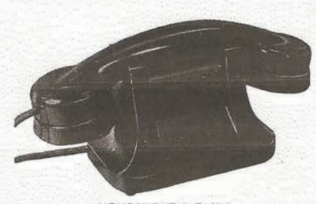
NOVOPHONE de TABLE

batteries, transformateurs etc. Le redresseur ATEA ALD. 110 est un élément d'alimentation directe, pouvant se raccorder à des réseaux, courant alternatif 110, 130 ou 220 V., - 40 à 60 per. Il fournit une tension filtrée de 6 V., courant continu 0,18 A. Une prise complémentaire de 12 V., courant alternatif 1 A. permet l'alimentation de réseaux de sonneries, etc.