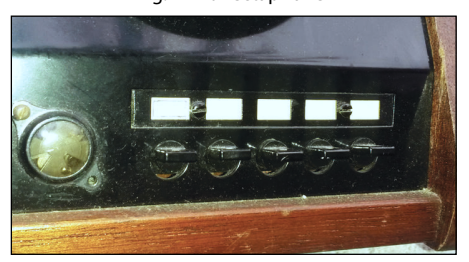
Fig. 2 5 keys to reach subscribers