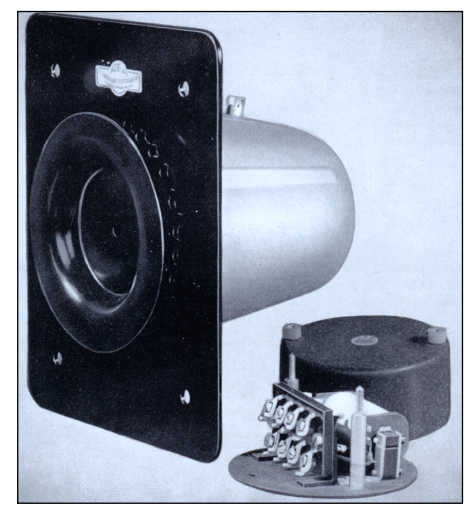
Fig. 4 A 1940s front door loudspeaker

The "boss" had such a device on his desk. He could call up to 5 of his em-